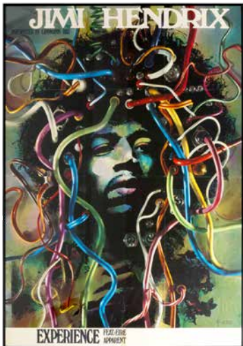
Jimi-Hendrix-Plakat mit Originalautogramm, 1969

DENN DIE ZEITEN ÄNDERN SICH... DIE 60ER JAHRE IN BADEN-WÜRTTEMBERG 22.12.2017 – 24.6.2018