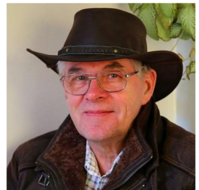
Hans Claesson Foto, Text und Layout

”I lived my childhood dream as a Commercial Deep Sea Diver in the North Sea oil fields, always with my camera! Now, after a long career in the service side of the printing industry, I continue my life interest in the sea, books and photos by writing short stories, books and photo books.”